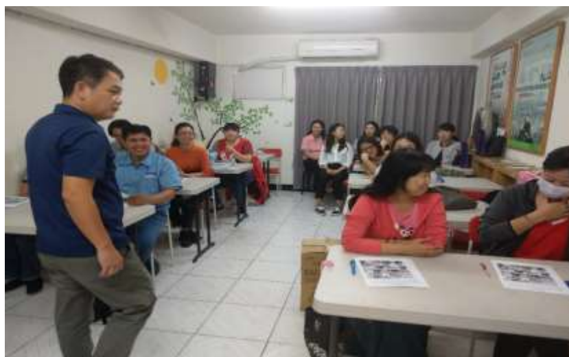
手語研習課程相片：台韓手語交流 拍攝日期：108年11月