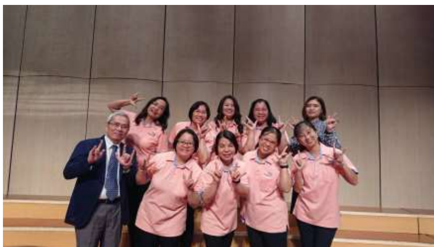
音樂會相片：平安基金會所屬身心障礙關懷中心代理主任(藍外套者)與志工隊 拍攝日期：107年11月