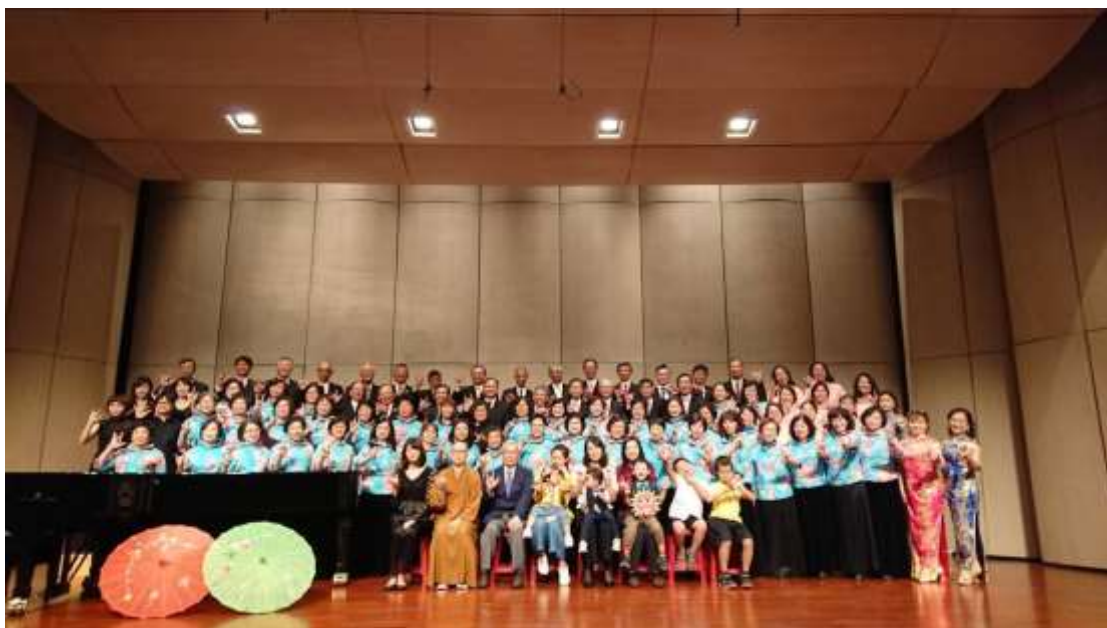
音樂會相片：結束後的大合照