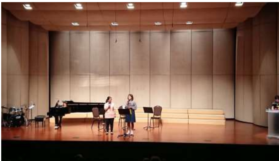
音樂會相片：節目中的聾人女孩(中)分享，以自身經驗作為出發點，更能表達聾人的處境 拍攝日期：107年11月