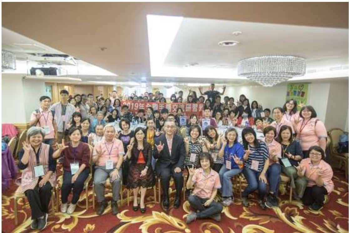
手語營相片：團體大合照，願每一位學員都能成為所在社區、職場、校園中聾人的幫助。 拍攝日期：108年11月