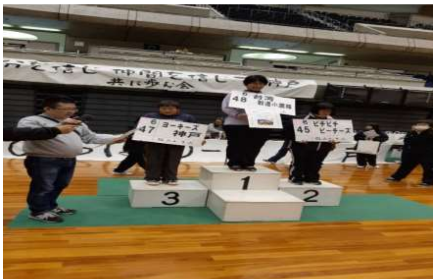
手語研習課程相片：台日手語交流 拍攝日期：108年09月