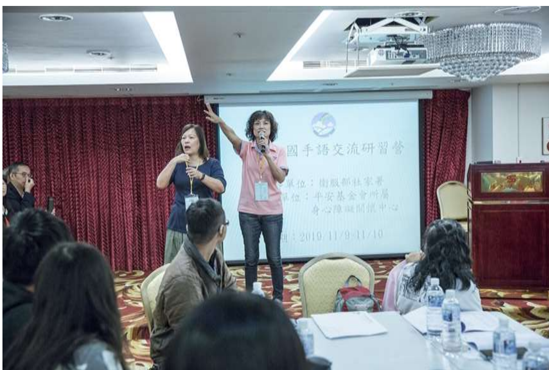
手語營相片：由主持人搭配手語翻譯員，宣布活動開始。