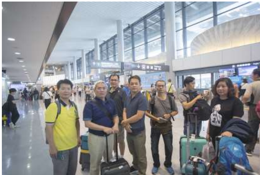
手語研習課程相片：台日手語交流 拍攝日期：108.09