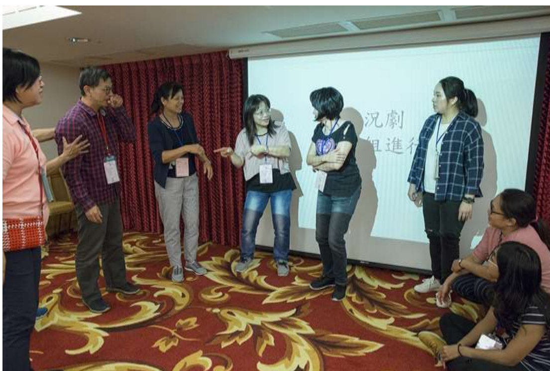
手語營相片：戲劇排練，藉著與聾人隊輔的合作，重現聾人在社會上遇到的困難。拍攝日期：108年11月