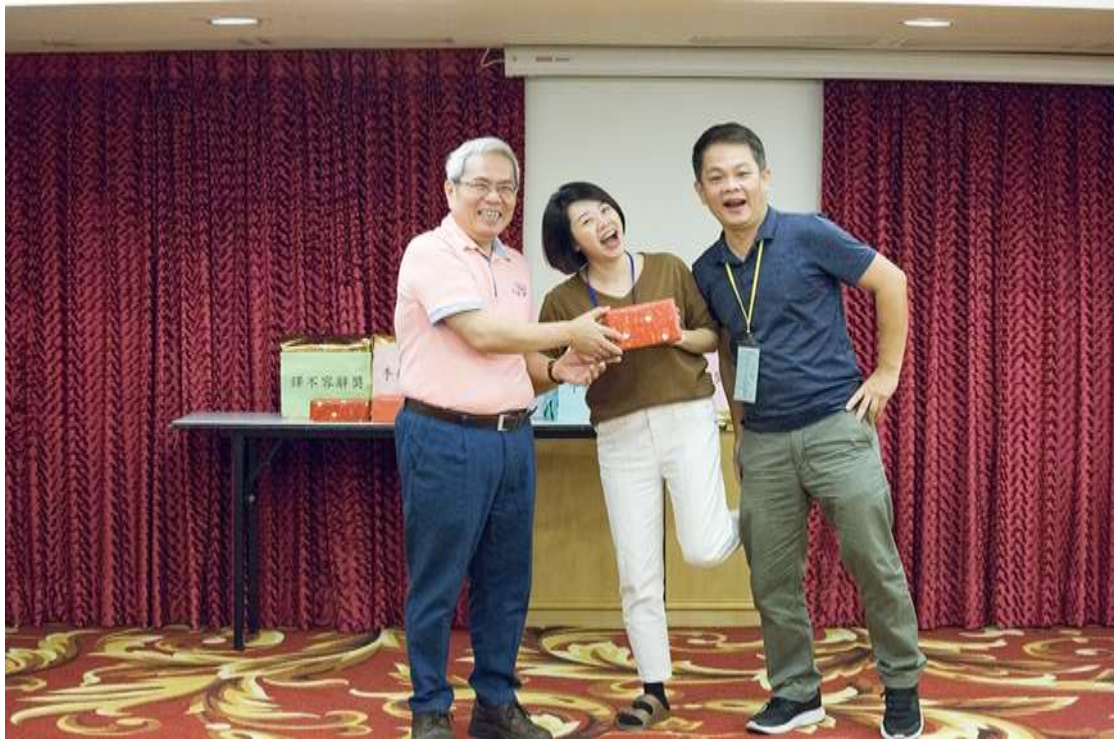
手語營相片：頒獎過程 拍攝日期：108年11月