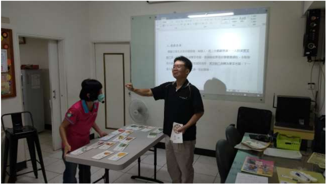
手語研習課程相片：聾老師搭配聽人助教透過圖卡提升學習成效 拍攝日期：108年05月