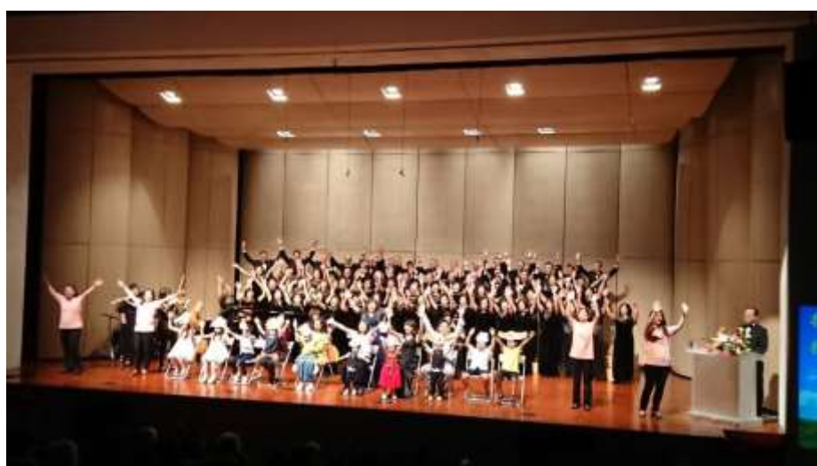
音樂會相片：手語歌演出裡的最後高潮 拍攝日期：107年11月