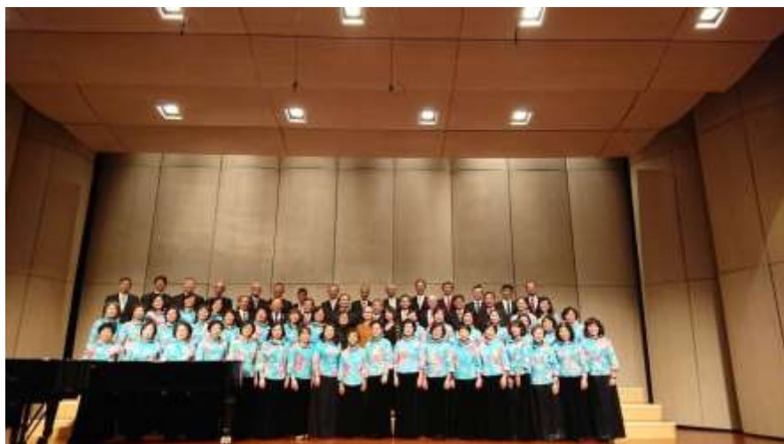
音樂會相片：星光合唱團團員 拍攝日期：107年11月10日