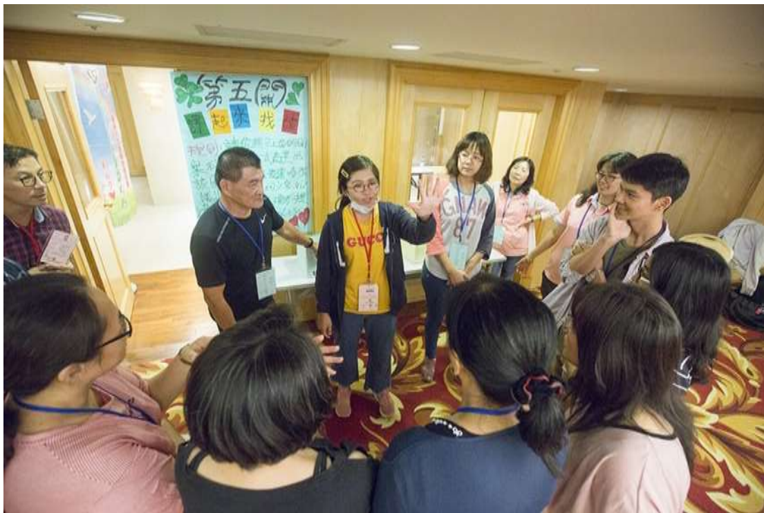
手語營相片：闖關活動現場，藉由學員之間的合作，體會如何以手語和聾人關主互動，並共同獲得好成績。拍攝日期：108年11月