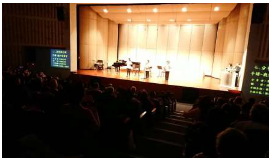
音樂會相片：志工隊的手語歌演出，雖燈光昏暗，但可看出座無虛席 拍攝日期：107年11月