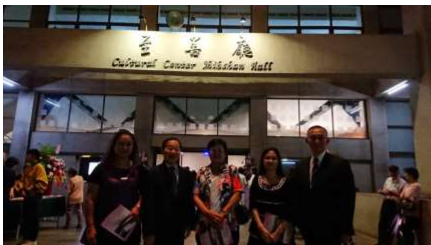
音樂會相片：高雄市文化中心至善廳大門 左二為身心障礙關懷中心主委 右一則是副執行長 拍攝日期：107年11月