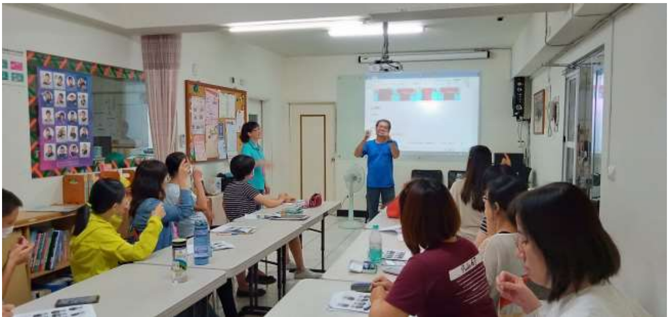
手語研習課程相片：聾老師搭配聽人助教幫助學生學習 拍攝日期：108年07月